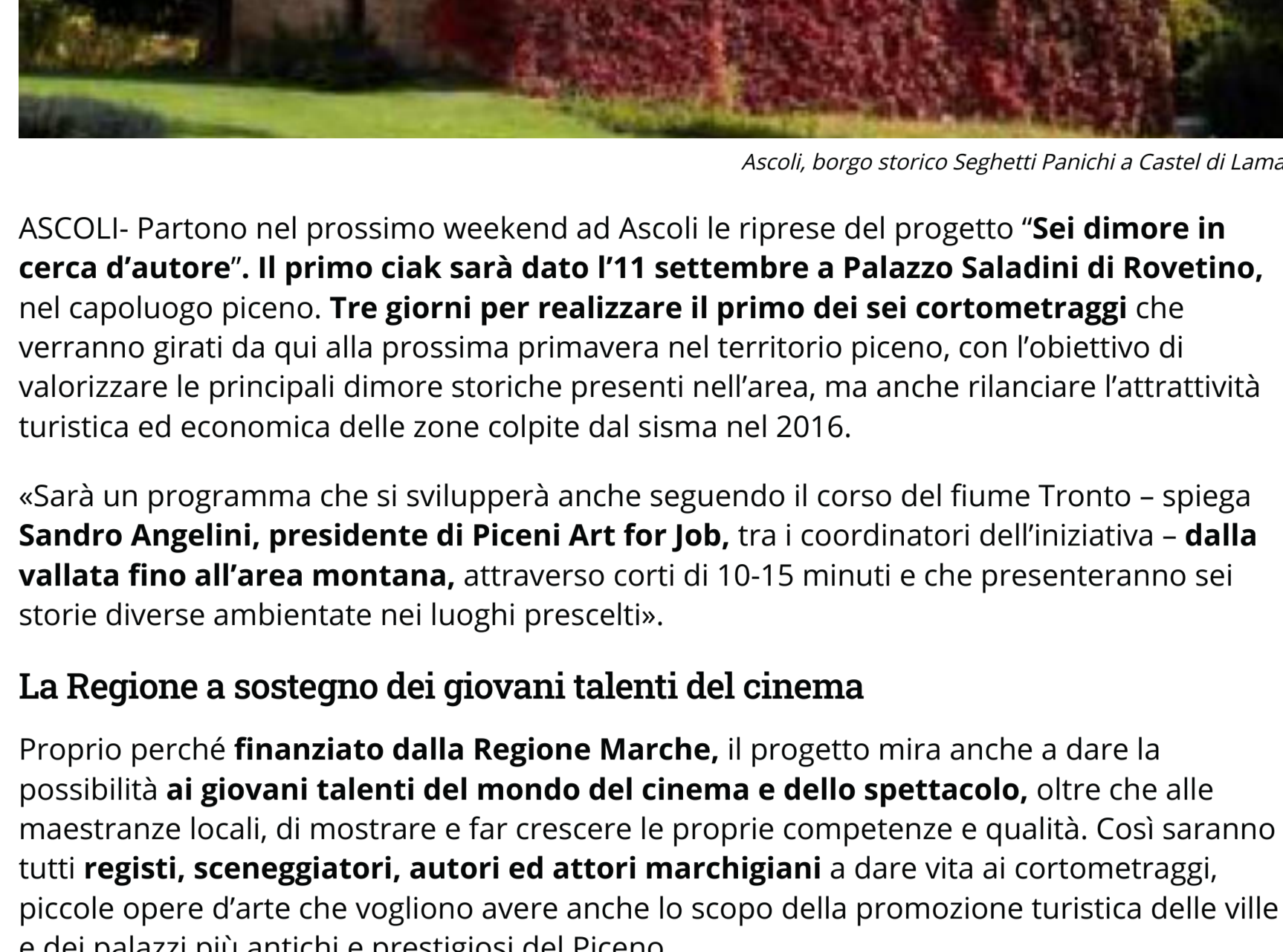
Ascoli, borgo storico Seghetti Panichi a Castel di Lama

ASCOLI- Partono nel prossimo weekend ad Ascoli le riprese del progetto "Sei dimore in cerca d'autore". Il primo ciak sarà dato l'11 settembre a Palazzo Saladini di Rovereto, nel capoluogo piceno. Tre giorni per realizzare il primo dei sei cortometraggi che verranno girati da qui alla prossima primavera nel territorio piceno, con l'obiettivo di valorizzare le principali dimore storiche presenti nell'area, ma anche rilanciare l'attrattiva turistica ed economica delle zone colpite dal sisma nel 2016.