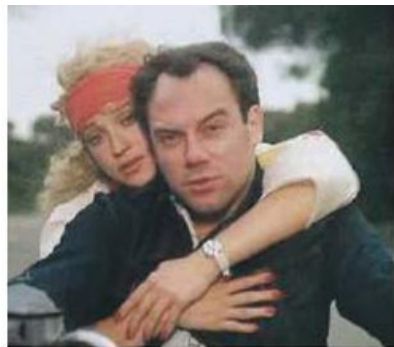
A destra una immagine di «Sapore di mare», in basso Carlo Verdone ed Eleonora Giorgi in «Borotalco»

film scelti, «riflettono i talenti che stavano emergendo come Nuti, Troisi, Verdone. Un cinema che riguardava la realtà ma nel quale c'era anche il desiderio di essere felici. L'Italia negli anni '80 esplose, il made in Italy vi trova la sua massima espressione. E' un momento divertente ma anche profondo. Lo ripercorreremo portando il cinema nelle piazze, facendo capire chi eravamo e chi siamo».