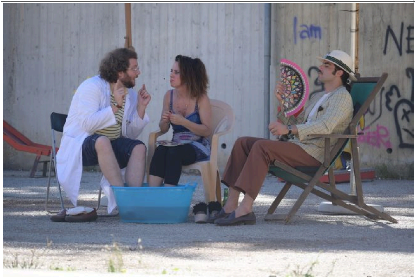
Un frame del film