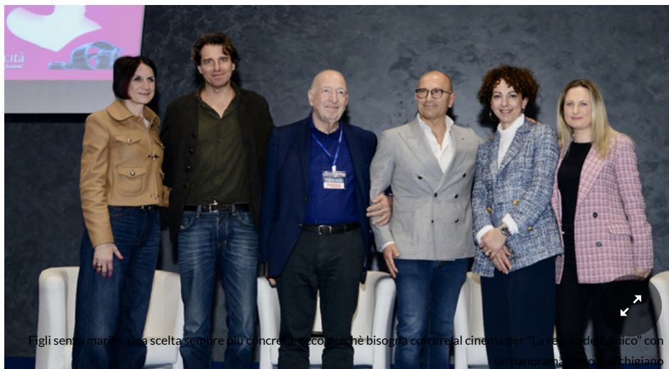
Figli senza marito, una scelta sempre più concreta: ecco perchè bisogna correre al cinema per "La regola dell'amico" con un panorama tutto marchigiano