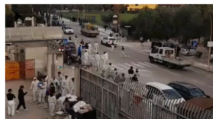
Gavettoni, cori e una bomba carta per i 100 giorni dall'esame