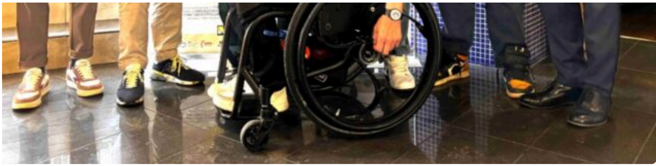
A destra il sindaco di Ancona Daniele Silvetti

Ma i protagonisti del film sono anche i panorami e gli scorci di Cupra Marittima e Ancona, in quanto il film è stato girato proprio tra le due città, per una pellicola che rende omaggio ai paesaggi marchigiani, tra viste mozzafiato e luoghi incantevoli. Nel capoluogo dorico i luoghi che hanno fatto da location alle scene del film sono dalla Mole Vanvitelliana a piazza del Plebiscito, da Portonovo alla Clinica Nemo e l'INRCA. Poi spiccano il mare, le spiagge e le campagne cuprensi. E in alcune scene del film si possono poi riconoscere anche altri iconici luoghi marchigiani, come Montemonaco, Foce e il Lago di Gerosa.