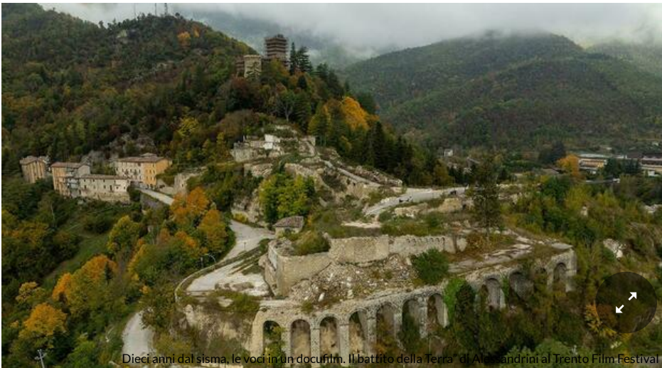
Dieci anni dal sisma, le voci in un docufilm. Il battito della Terra” di Alessandrini al Trento Film Festival