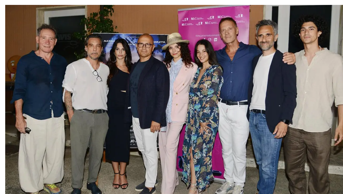
Successo a Porto San Giorgio per l'attesa anteprima nazionale di Blue, girato tra Offida, Fermo e Porto San Giorgio. L'Arena...